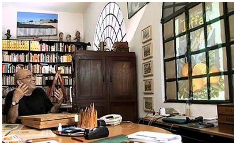
גלריית הצלמים, ההיסטוריונים ואוצרי האמנות לא מסייעת לסרטו של סיון

למרבה הצער, אפילו השימוש בפרי הדר האדמוני כמטאפורה למהלכים ההיסטוריים והאידאולוגיים שפקדו את ארץ ישראל מאז סוף המאה ה-19 אינו מקורי במיוחד, שכן כבר לפני עשור, יצר עמוס גיתאי את "בארץ התפוזים" (1998), שבו הביא את ההיסטוריה של העימות הציוני-פלסטיני מבעד לפרספקטיבה הכלכלית הקשורה בענף הפרדסנות.