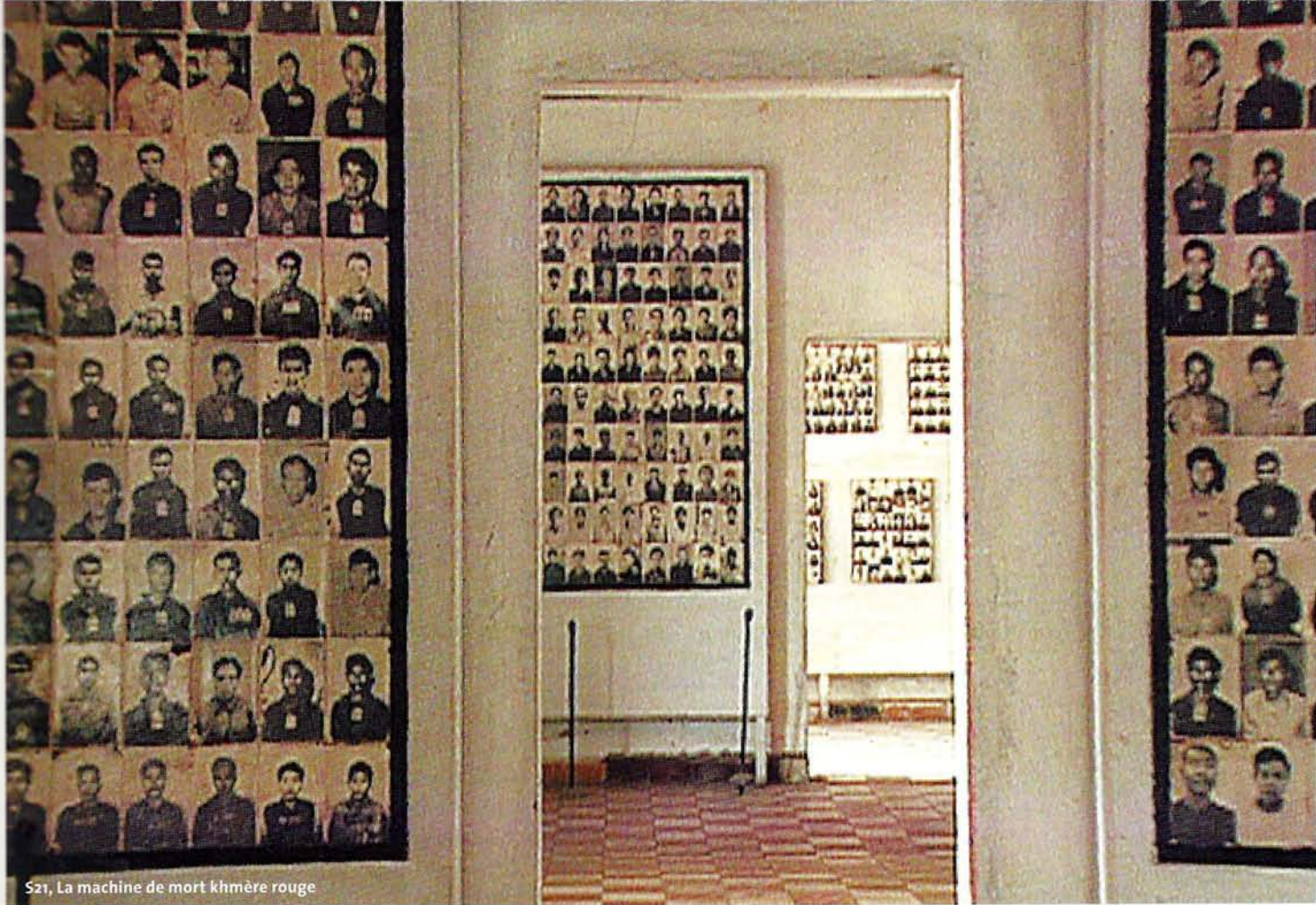
S21, La machine de mort khmère rouge