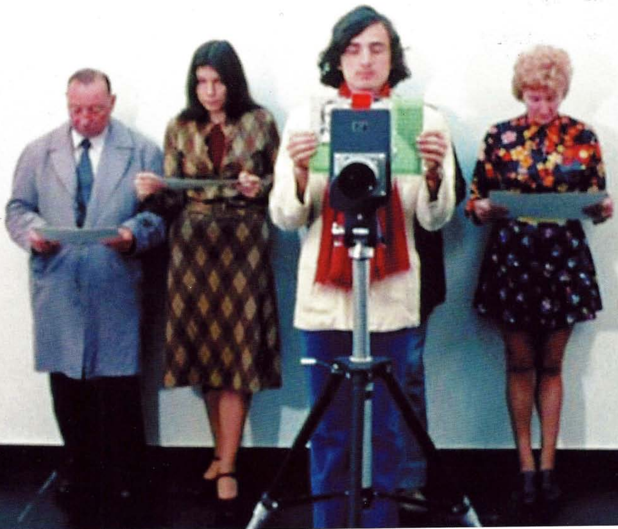
Ici et ailleurs