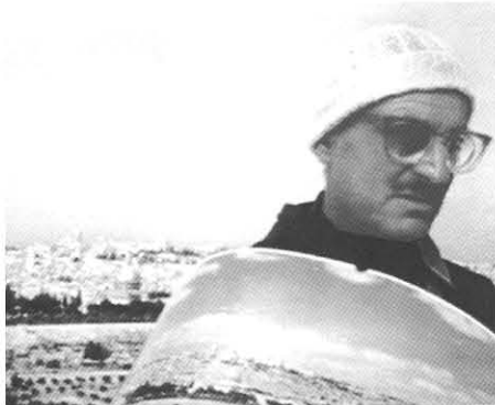
El síndrome borderline de Jerusalén

En 1991, durante la Guerra del Golfo, a diez kilómetros de Tel Aviv se edifica un parque temático que llevará por nombre Israelandia, al mismo tiempo que la ciudad está siendo bombardeada. La película cuenta la historia del grupo de hombres que participaron en la construcción del lugar: un conductor de máquinas excavadoras israelí, dos obreros palestinos, un arquitecto y escultor alemán y un agente inmobiliario judío proveniente de Georgia. Lo único que tienen en común es su trabajo: la construcción de un parque temático donde el odio reina omnipresente. La sociedad israelí, enclave de Occidente en el corazón de Medio Oriente, se muestra a través de una metáfora surrealista, cargada de un descarnado sentido del humor.